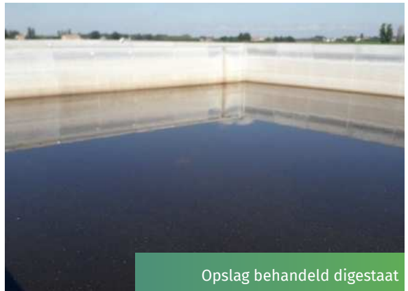
Opslag behandeld digestaat

Door nutriënten uit digestaat te winnen tot een stabiel product met een klein volume (neerslag), ontstond een helder behandelde fractie met een lager stikstof-, fosfor- en organisch stofgehalte vergeleken met het onbehandelde digestaat.