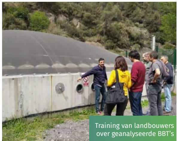
Training van landbouwers over geanalyseerde BBT's

De Manure Management Tools Operational Group heeft een beslissingsondersteunende tool ontwikkeld die het potentieel voor biogasproductie beoordeelt bij het opslaan van mest in flexibele vijvers. Deze tool beoordeelt de transformatie van organisch materiaal in de mest, de productie van methaan, de productie van warmte en elektriciteit, die energieproductie uit fossiele brandstoffen vervangt en de uitstoot van broeikasgassen vermindert. De nieuwigheid van deze tool ligt in de opname van de effecten van organische stikstof die wordt omgezet in ammonium en de potentiële toename van ammoniakemissies als gevolg van de stijging van de pH in de anaeroob vergiste mest (digestaat). Bovendien worden biogasininstallaties op het landbouwbedrijf gebouwd, zodat de landbouwer mesttransport vermijdt, wat de kosten verlaagt. Methaanemissies van opgeslagen digestaat zullen lager zijn vanwege een verlaagd organisch stofgehalte als het digestaat wordt afgekoeld tot omgevingstemperaturen met warmtewisselaars. Het project biedt aanbevelingen over de efficiëntie